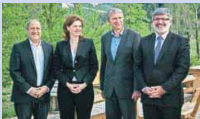
Predsednica vlade maja na Jezerskem