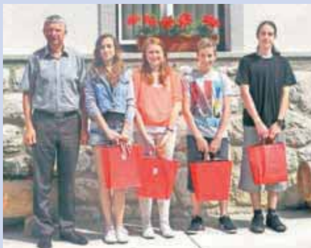
Župan z učenkami in učenci, ki so končali osnovno šolanje.