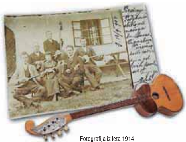
Fotografija iz leta 1914

Vencelj Preddvor d.o.o. Belska 15, Preddvor