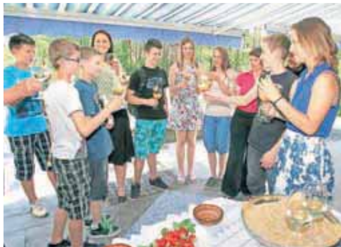
Na zdravje uspehu in prihodnosti